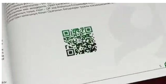
Рис. 6. Страница альбома «Орал» с GR