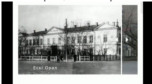
Рис. 7. Страница альбома «Орал» с GR