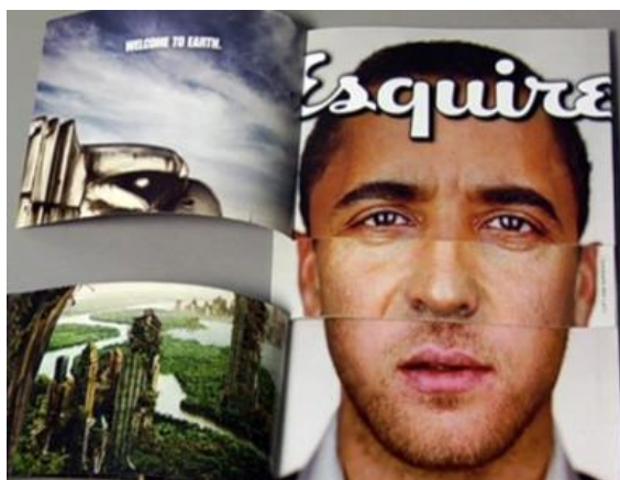
Рис. 5. Пример гибридной технологии в изготовлении печатного издания

Интерактивность . И эта инновация пришла на страницы печатных изданий также из интернета, где интерактивность не только легка, но и обязательна. Перенести взаимодействие с аудиторией на лист бумаги гораздо сложнее, но результат будет превосходный. Интерактивность используют также и сами печатные издания с целью саморекламы и установления прочных эмоциональных связей с читателями. Вот пример: Esquire предложил читателям игру с лицами известнейших людей прямо на обложке.