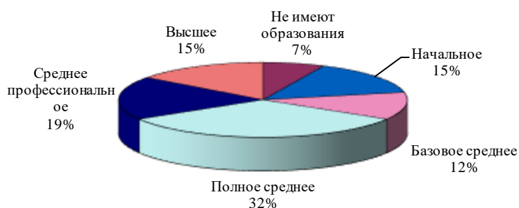
Диаграмма 2. Уровень образования респондентов в возрасте 18 лет и старше

В то же время анализ результатов исследования, проведенного Центром Тахлил в 2004 году в Узбекистане, показал, что высокие показатели образования инвалидов достигаются в основном за счет возрастной группы старше 35 лет, т.е. тех инвалидов, которые получали образование еще в советский период.