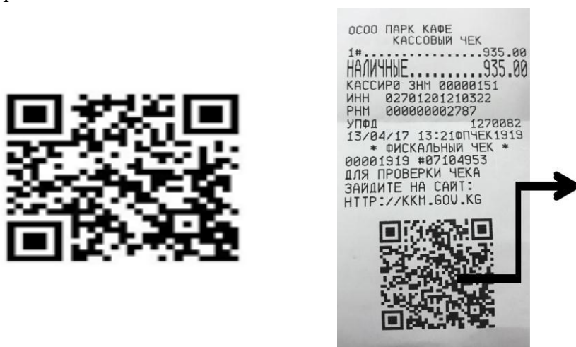
Рис. 2. Реквизиты чека онлайн-кассы.

Отныне у кассового чека появятся новые реквизиты, некоторые из них представлены на Рис.2.