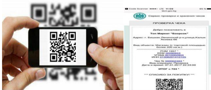
Рис. 1. Информация по совершенным покупкам и сделкам

При этом продавец будет обязан пересылать электронный чек покупателю на его электронную почту или смартфон (по номеру телефона), если покупатель предоставит такие данные. Кроме этого, по требованию покупателя, продавец будет обязан выдавать бумажный чек с QR кодом [2]. Получив чек, покупатель через Интернет, в частности, может проверить, были ли сведения о покупке переданы в ИГНС. Код распознается автоматически либо нажатием на соответствующую кнопку для активации сканера. После, на экране появится информация, зашифрованная в QR-коде.