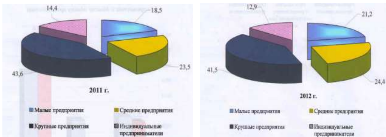
Структура промышленной продукции по типам предприятия (в %х к общему объему производства)

За пять последних лет (с 2008 г. по 2012 г.) наибольшее количество волокна хлопкового было выпущено в 2012 г. - 10205,2 тонны, наименьшее - в 2009 г. - 6383,0 тонны.