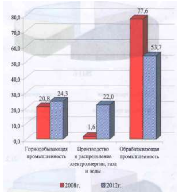
Рис. 1 Структура промышленного производства по видам экономической деятельности (в %х к общему объему производства)

Для достижения поставленной цели необходимо обеспечить решение следующих задач стратегии экономического развития Ошской области.